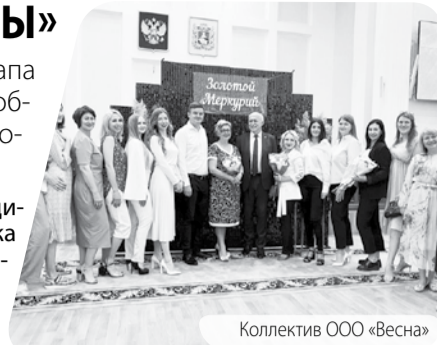
Коллектив ООО «Весна»