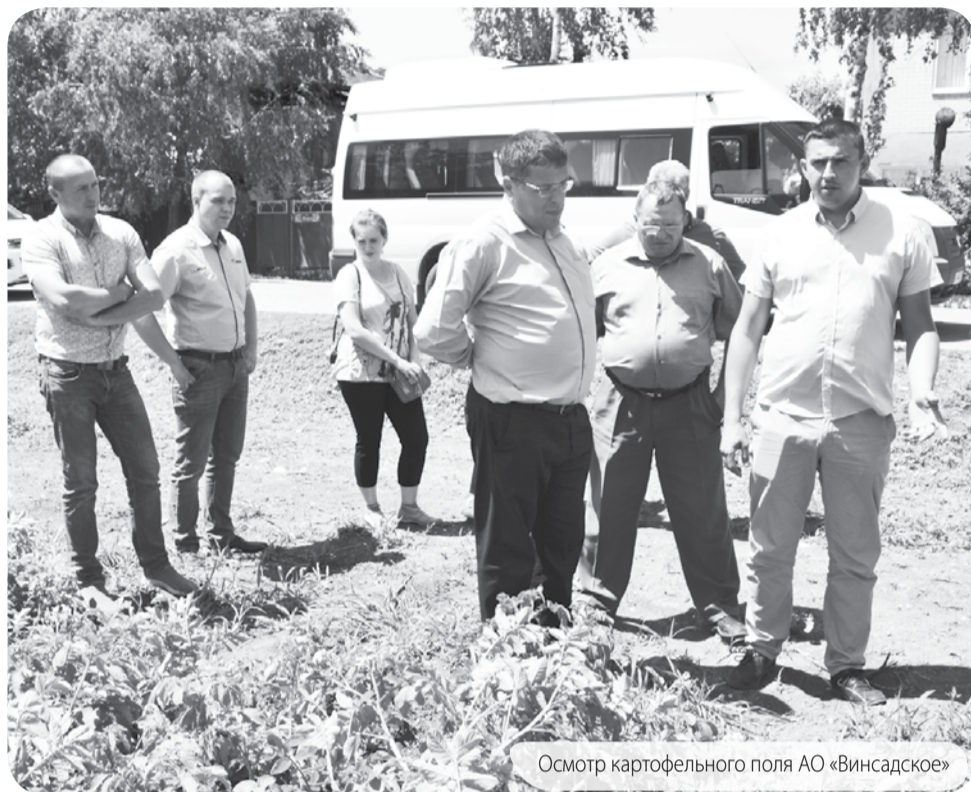
Осмотр картофельного поля АО «Винсадское»

Акционерное общество «Винсадское» - хозяйство многопрофильное, в чем участники объезда смогли убедиться, осмотрев поля рапса. Это хозяйство - одно из немногих в округе, культивирующих данную культу-