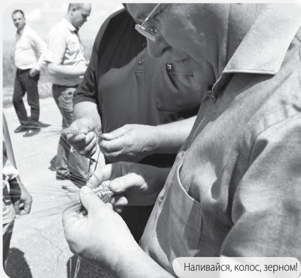
Наливайся, колос, зерном!