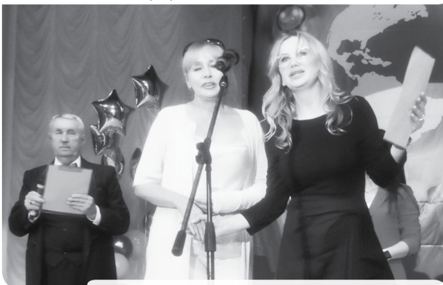
Во время проведения торжества в окружном центре ко Дню медицинского работника.